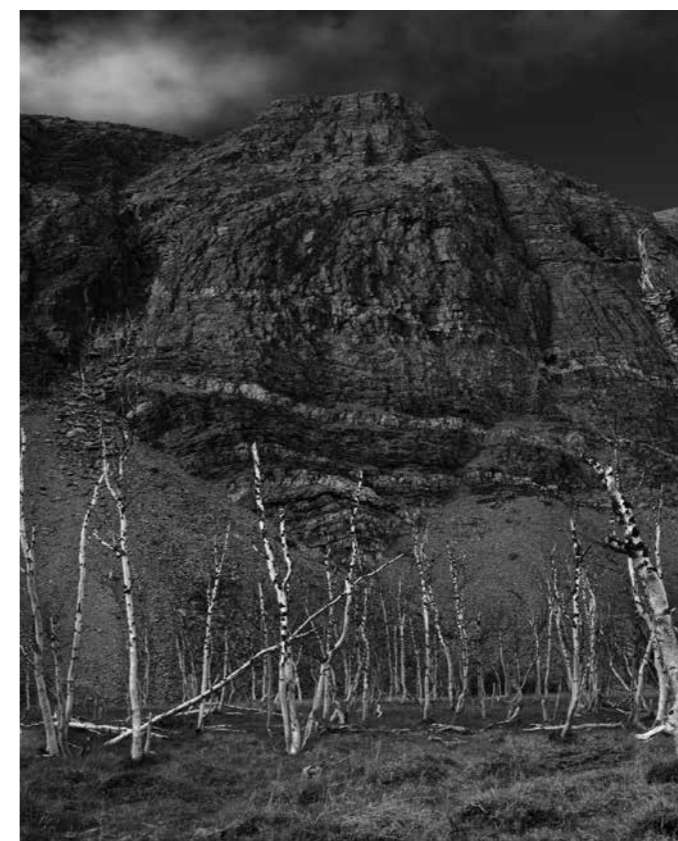
Sigfrid Hernes, Så går eg inn mellom gamle trer , fra serien Komme vekk , fotografi, 2011