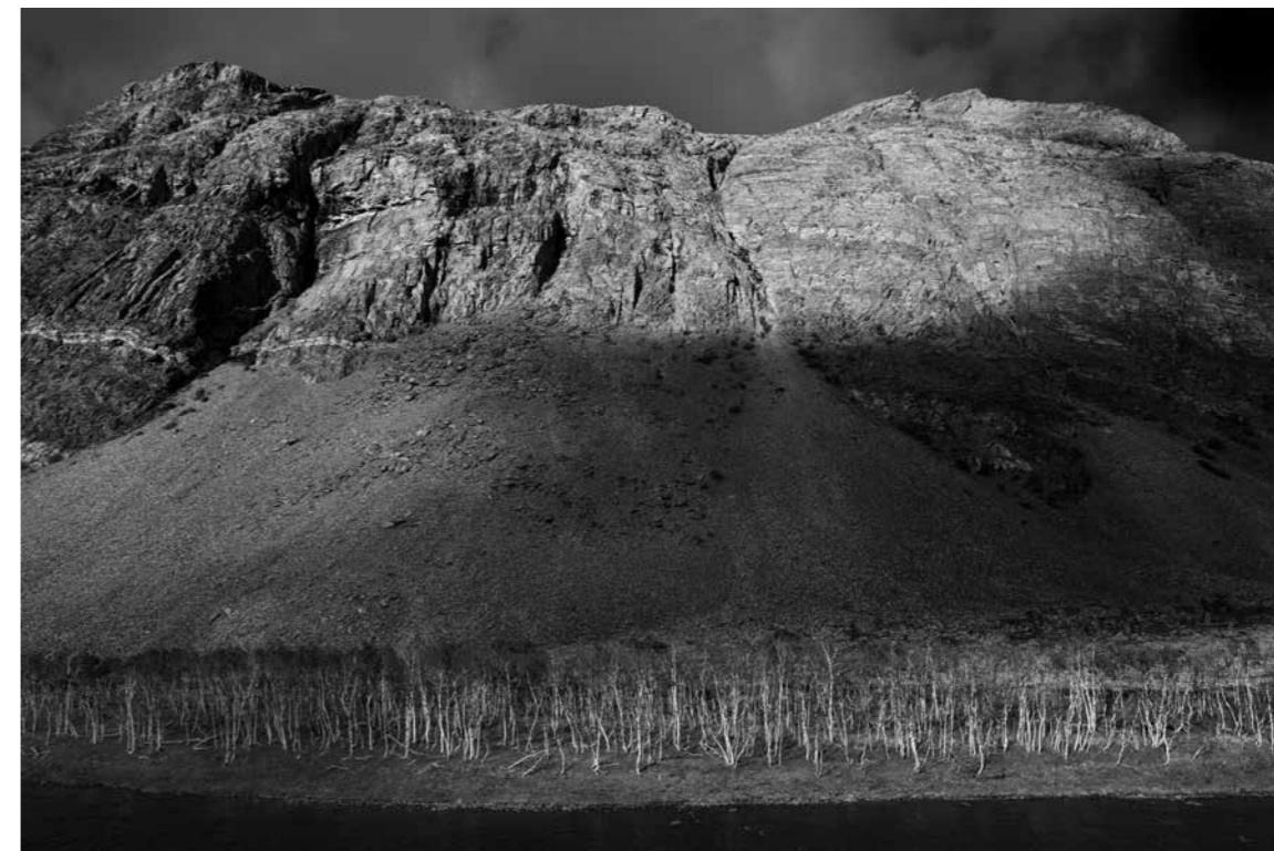
Sigfrid Hernes, Eg er til , fra serien Komme vekk , fotografi, 2011