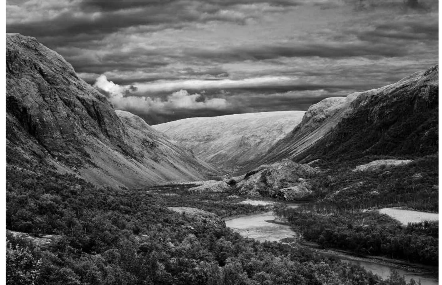
Sigfrid Hernes, fra serien Lekeplassen min , fotografi, 2008

På grunn av arbeidsstipend og Artist in Residence Program har jeg fått muligheter til å reise og gjennomføre lengre opphold i nordområdene på russisk side også. Det som slår en når en beveger seg i landskap på russisk side, er alle de menneskeskapte elementene som preger landskapet. Særlig gruvevirksomhet